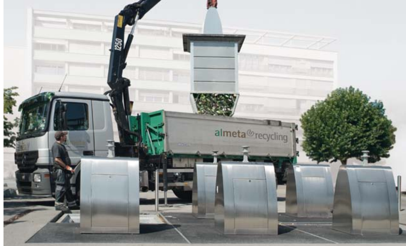
Secteur communal: un camion muni d'une grue Kinshofer vide une installation enterrée moderne.