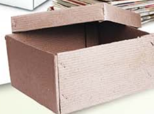
Carton et papier