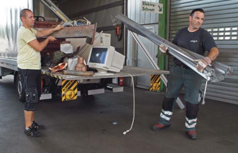
Secteur artisanal: enlèvement ou réception, l'équipe d'Almeta Recycling donne volontiers un coup de main.