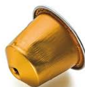
Capsules de café

En notre qualité de centre de recyclage, nous offrons des conventions de reprise attractives – basées sur la bourse des matières premières – aux prix du marché.