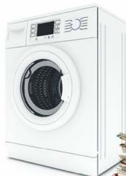
Électronique de bureau, appareils électroménagers grands et petits